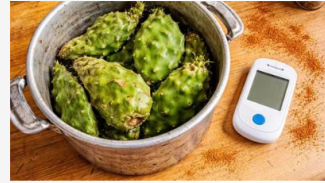
GlucosZen Diabetes: mi ardor de pies paró y el doctor quedó en shock