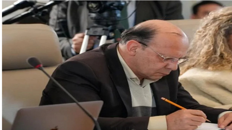
Germán Ávila Plazas, actual Ministro de Hacienda y Crédito Público de Colombia.

El Ministerio de Hacienda y Crédito Público aclaró que el Gobierno nacional no tiene planes de vender su participación en Ecopetrol . Esto surge luego de dudas generadas por un informe enviado al Congreso sobre activos que podrían ser enajenados.