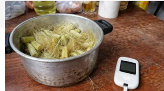
Glucoszen Detén el entumecimiento de pies hoy con un truco de Bogotá