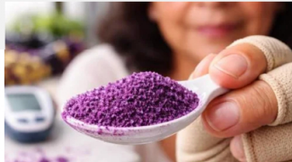
Glucoszen ¡Diabéticos, prueben ya el truco secreto de la canela!