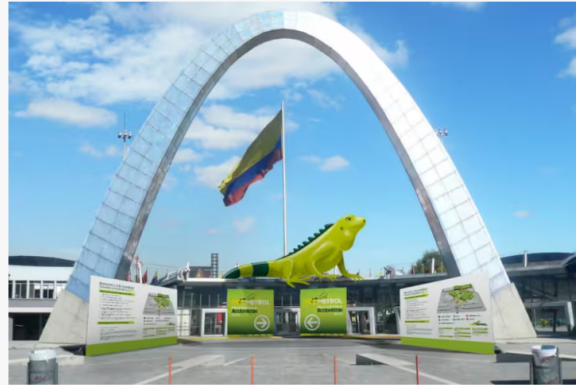
Ecopetrol. Imagen de referencia.