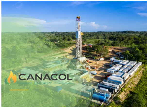
La compañía es actualmente el segundo mayor productor de gas natural en Colombia, solo por detrás de Ecopetrol, que concentra el 71%.

Canacol solicitó a un tribunal en Canadá cancelar contratos de suministro de gas en Colombia, en medio de su reorganización financiera, lo que genera incertidumbre sobre el abastecimiento nacional. La compañía es actualmente el segundo mayor productor de gas natural en el país.