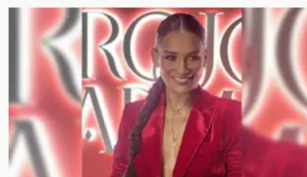
Fiscalía judicializa a la actriz Yeimy Paola Vargas por usar título falso de teatro