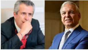
Escándalo Ungrd: acusados exministros Bonilla y Velasco por direccionamiento de contratos