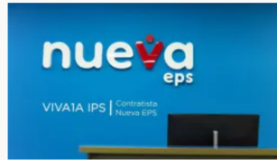
Nueva EPS: Procuraduría abre investigación disciplinaria a Luz María Múnera y Jorge Iván Ospina