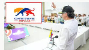
Dueño de la cuenta para la constituyente habla: "No nos ha entrado dinero"