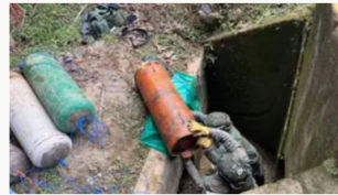
Ejército y Policía neutralizan más de media tonelada de explosivos en la vía Panamericana