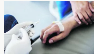
Colombia amplía la eutanasia a pacientes no terminales