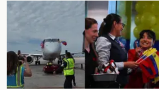
Primer vuelo de EE.UU. a Venezuela en siete años: American Airlines aterrizó en Caracas