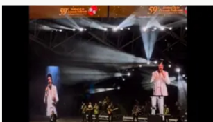
Recreación digital de Rafael Orozco emociona en la inauguración del Festival Vallenato 2026