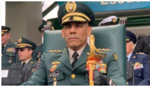
Campana de De la Espriella acepta renuncia del general Zapateiro tras imputación por acoso sexual