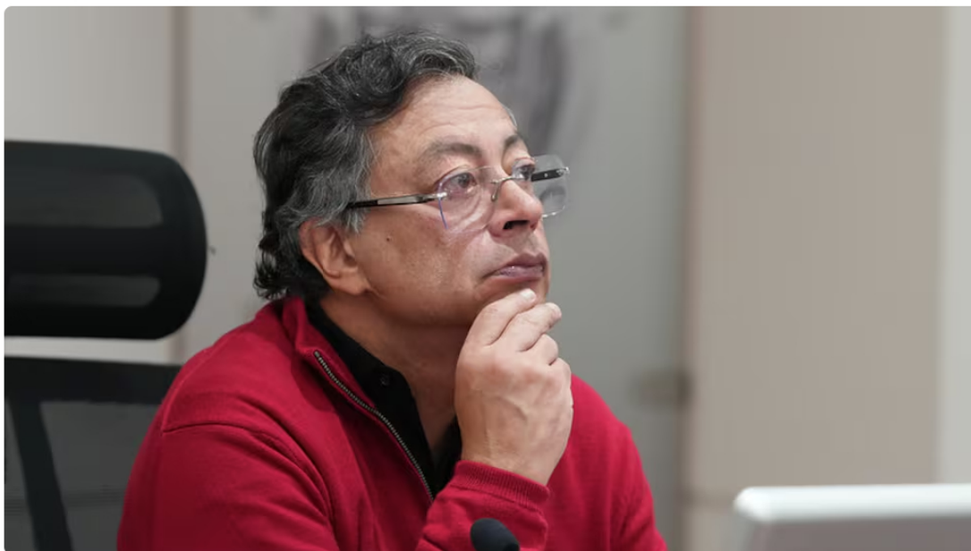
El presidente Gustavo Petro alertó sobre un supuesto plan en su contra.

Uno de los apartes de una extensa publicación que hizo el presidente de la República, Gustavo Petro, en su cuenta personal de X, llamó la atención. Allí habló de un supuesto plan para “cogerlo preso”.