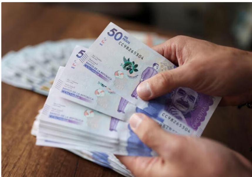
El monto será pagado bajo modalidad de crédito durante la vigencia del contrato.

modalidad de crédito, mecanismo que permite estructurar el flujo de pagos conforme a la ejecución del contrato.