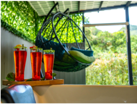
Vientos del Nare: El nuevo santuario de bienestar en el Oriente antioqueño