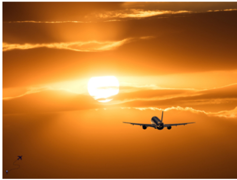
Semana Santa 2026: Aerolíneas proyectan movilizar a más de 2 millones de pasajeros en Colombia