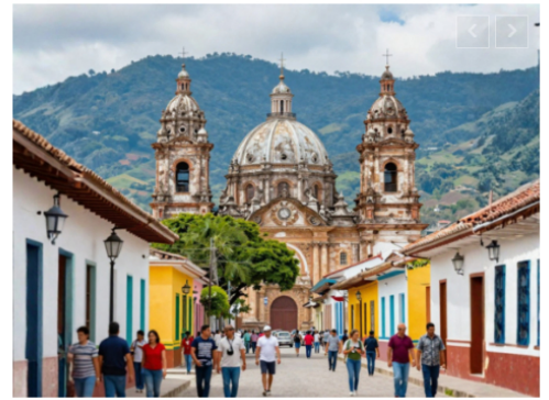
Semana Santa 2026: Agencias de ANATO proyectan estabilidad y crecimiento en medio de un clima optimista