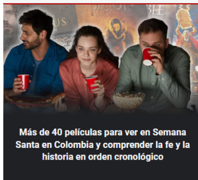
Más de 40 películas para ver en Semana Santa en Colombia y comprender la fe y la historia en orden cronológico