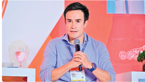
Vicepresidente de Ecopetrol.