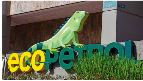
Una denuncia circula entre altos ejecutivos del sector energético y hoy está en manos de la Superintendencia de Industria y Comercio.

En un escrito, un ciudadano detalló que existirían indicios de "la posible existencia de conflictos de intereses no declarados relacionados con proyectos de gasificación considerados estratégicos para el país".