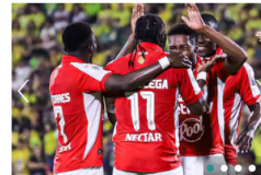
FÚTBOL Bucaramanga pierde en casa ante Santa Fe y agrava su momento en Liga BetPlay