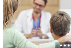
SALUD Fimosis en la infancia: cuándo observar e intervenir