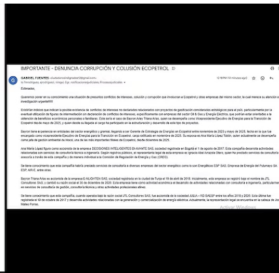
Documentación de la denuncia por supuesta corrupción en Ecopetrol .

SEMANA conoció que la Superindustria recibió la denuncia, pero aún no ha actuado respecto a estos señalamientos contra Triana.