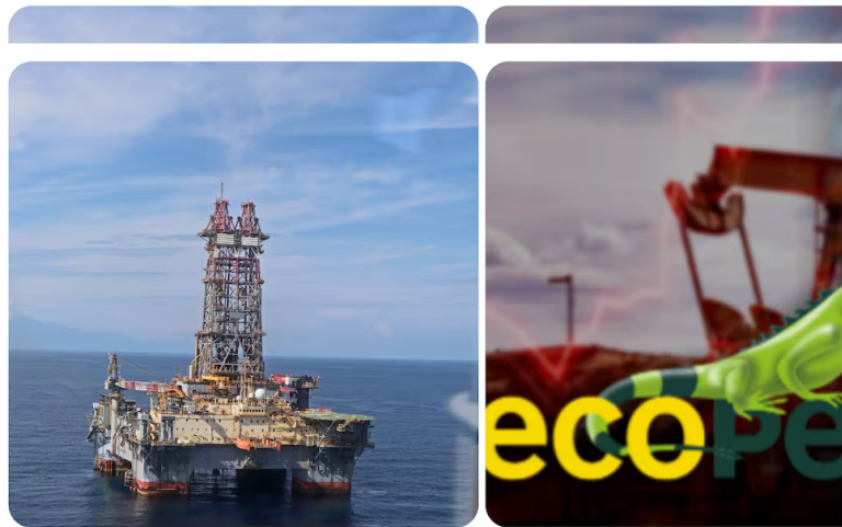
La USO negó que se esté preparando un paro sindical en Ecopetrol.

La Unión Sindical Obrera de la Industria del Petróleo (USO) negó las declaraciones de un dirigente de esa organización que aseguró que se realizaría un paro para exigir la salida de Ricardo Roa de la Presidencia de Ecopetrol. Según esa instancia, lo anunciado por Roa corresponde a una decisión institucional.