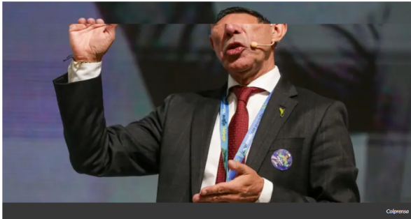
Ricardo Roa, presidente de Ecopetrol, dijo que no renunciará a su cargo. Lo manifestó poco antes de que empezara la asamblea de accionistas de la compañía estatal, que se adelanta este viernes 27 de marzo.