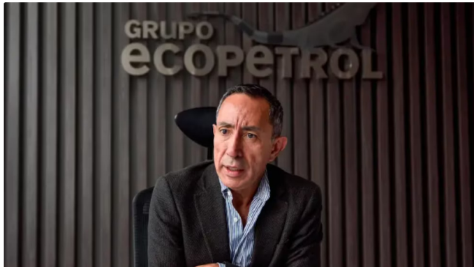
Ricardo Roa aseguró que no dejará la Presidencia de Ecopetrol

En conversación con Caracol Radio , el presidente de Ecopetrol indicó que, pese a la imputación de cargos en su contra y las indagaciones, no contempla dejar su cargo en la estatal petrolera. Aseguró que puede defenderse ante los estrados.