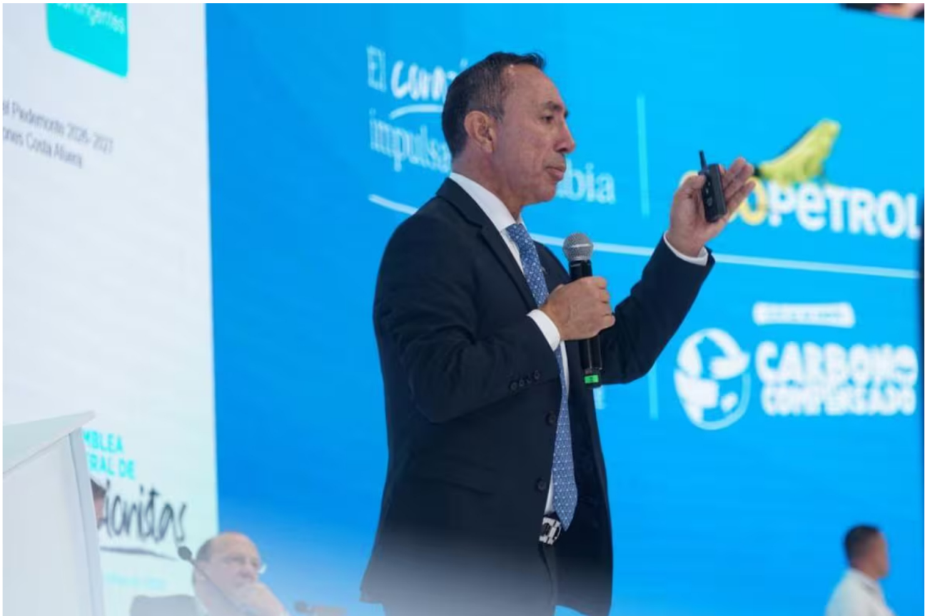
Abuchean a Ricardo Roa, presidente de Ecopetrol, en plena asamblea.

Siga las noticias de El Universal en Google Discover