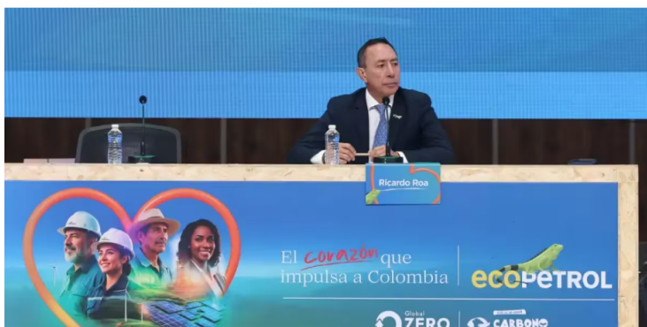
Abuchean a Ricardo Roa, presidente de Ecopetrol, en plena asamblea.

Otro de los puntos abordados fue el impacto del Fondo de Estabilización de Precios de los Combustibles (FEPC), cuyo déficit ha representado una carga fiscal cercana a $65 billones. Según el directivo, el ajuste realizado por el gobierno equivale a “cuatro reformas tributarias”, en referencia a la magnitud del esfuerzo fiscal.