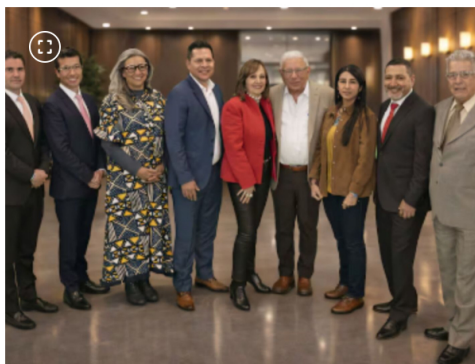
Miembros de la junta directiva de Ecopetrol.