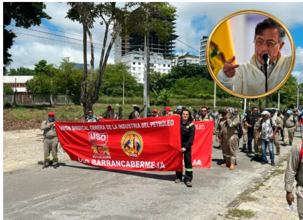
Gustavo Petro cuestionó el manejo histórico de recursos petroleros y pidió priorizar inversiones en energías limpias.

Petro cuestionó a la USO en medio de altos precios del petróleo y advirtió decisiones en Ecopetrol para evitar crisis futura y garantizar inversiones estratégicas.