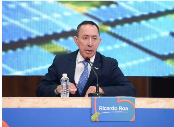
El presidente Ricardo Roa fue recibido con gritos y protestas justo cuando se disponía a presentar su informe anual de gestión correspondiente al último año.

La Asamblea de Ecopetrol avanza entre abucheos contra Ricardo Roa. Accionistas exigen su salida y proponen debatir su continuidad, pero la iniciativa fue rechazada, elevando la tensión.