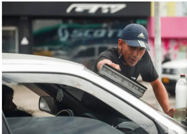
La informalidad laboral en Colombia golpea con mayor fuerza a jóvenes, mujeres y población rural.

Aunque el desempleo ha bajado, un informe advierte que la informalidad sigue siendo el principal desafío del mercado laboral en Colombia, con niveles críticos en zonas rurales y poblaciones vulnerables. Solo 42% cotiza a pensión.