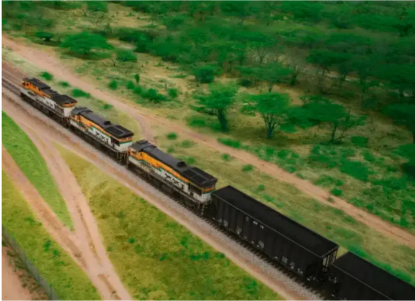
El hecho reaviva la preocupación por la seguridad, el empleo y la estabilidad económica de la región.

El hecho más reciente ocurrió en la madrugada de este jueves y se convirtió en el cuarto ataque registrado en lo que va de 2026, luego de los nueve ocurridos el año anterior.