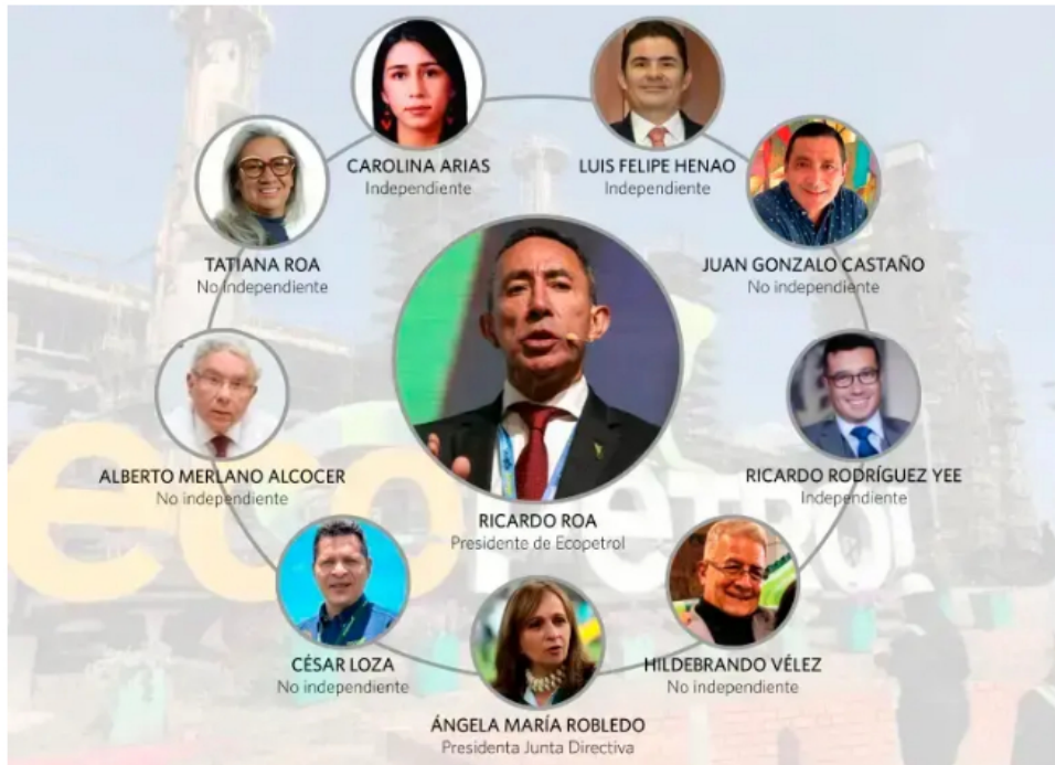
Junta directiva de Ecopetrol.