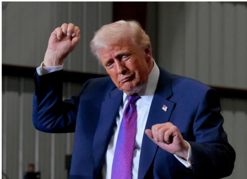
Estados Unidos incluirá la firma de Donald Trump en sus billetes como parte de la conmemoración de los 250 años de independencia.