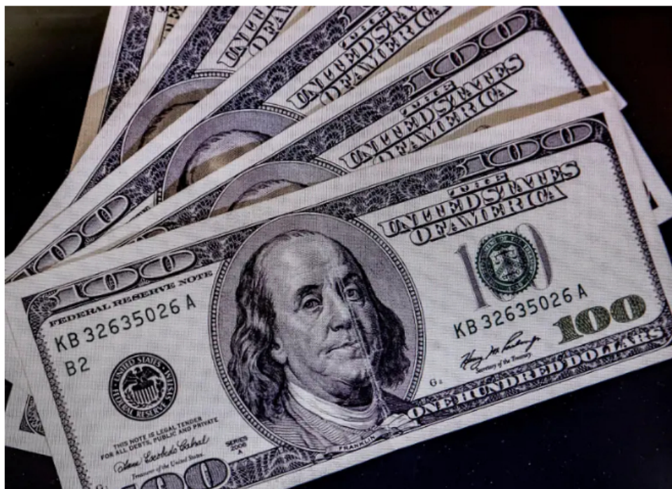
El Gobierno también aprobó una moneda de oro conmemorativa con la imagen del presidente y símbolos nacionales.