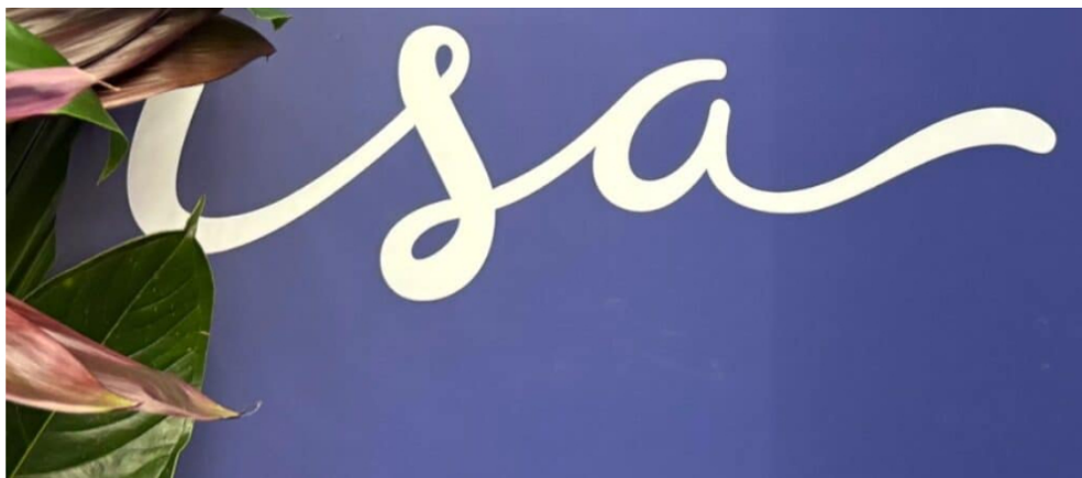
ISA.