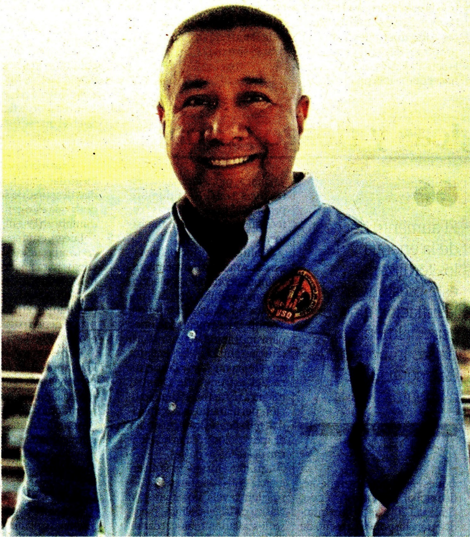
Martín Ravelo, presidente de la Unión Sindical Obrera (USO).