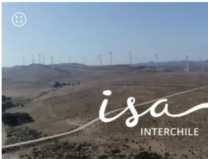
ISA Interchile