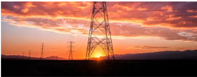
Panorámica de la red de transmisión Cardones-Propailco en Chile, del Grupo ISA