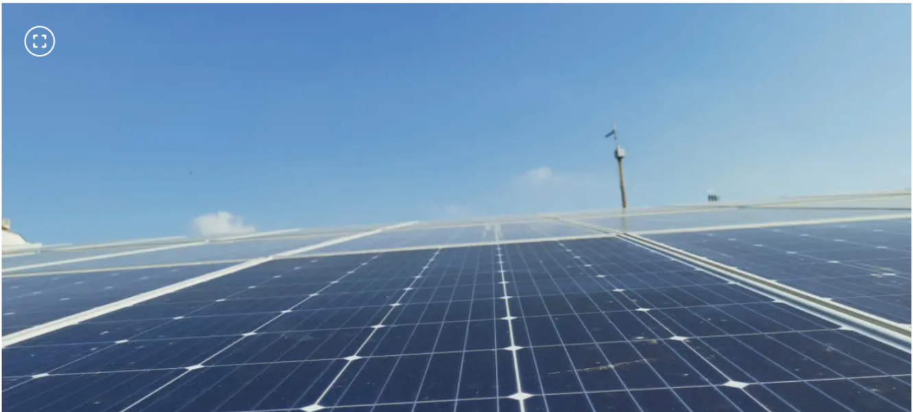
Esta es la nueva iniciativa de Ecopetrol e ISA para las Universidades de país.

La junta detalló los resultados económicos y el proceso jurídico tras la nulidad del nombramiento de Carrillo.