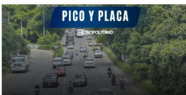
Así será el pico y placa en