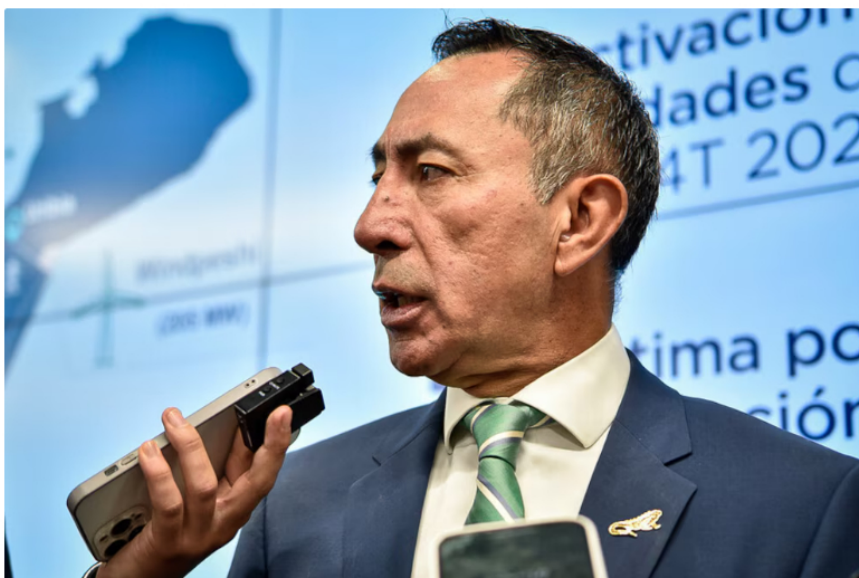
El presidente de Ecopetrol , Ricardo Roa, rechazó categóricamente los señalamientos y sostuvo que las acusaciones carecen de base y realidad

Ricardo Roa, presidente de Ecopetrol , respondió a los señalamientos de Associated Press afirmando que las acusaciones carecen de "toda realidad o lógica". Roa subrayó que las imputaciones no corresponden a la operativa ni a los hechos relativos a la estatal petrolera. Además, el gobierno colombiano, hasta el cierre del informe, no ha emitido ningún comunicado oficial adicional en relación con la investigación difundida.