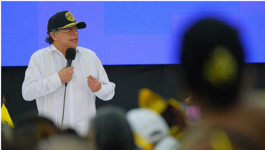
La DEA menciona a Gustavo Petro en una investigación preliminar por posibles vínculos con el narcotráfico internacional, sin pruebas concluyentes

Una investigación de la agencia Associated Press divulgada el 21 de marzo de 2026 puso bajo escrutinio a la administración de Gustavo Petro al revelar que la DEA analiza registros que sugieren el presunto uso de funcionarios y exasistentes de campaña para lavar dinero proveniente del narcotráfico a través de la estatal Ecopetrol .