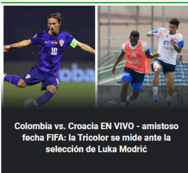
Colombia vs. Croacia EN VIVO - amistoso fecha FIFA: la Tricolor se mide ante la selección de Luka Modrić

Etapa 4 de la Vuelta a Cataluña: el británico Ethan Vernon fue el gran ganador, y Santiago Buitrago fue el colombiano más destacado