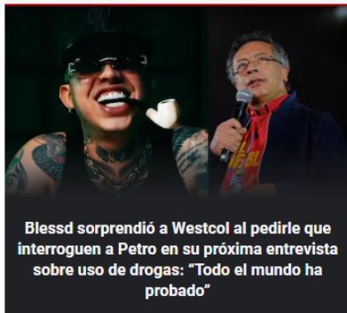
Blessd sorprendió a Westcol al pedirle que interroguen a Petro en su próxima entrevista sobre uso de drogas: "Todo el mundo ha probado"