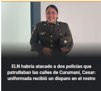
ELN habría atacado a dos policías que patrullaban las calles de Curumaní, Cesar: uniformada recibió un disparo en el rostro

Plan pistola en Cauca: un policía resultó herido tras ataque armado en Caldon; denuncian hostigamiento