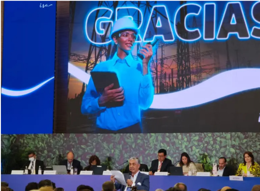
Asamblea de accionistas de ISA.

ISA eligió su nueva junta 2026-2028 con dominio de Ecopetrol , en medio de fuertes cuestionamientos por solvencia moral, independencia y gobierno corporativo.