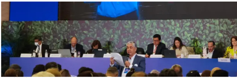
Asamblea de ISA.