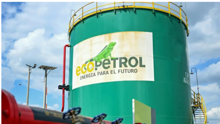
Imagen de un tanque de almacenamiento de petróleo crudo en la planta de la petrolera colombiana Ecopetrol en Acacias, departamento del Meta.

El sindicato espera que en esa sesión se tome una decisión sobre la continuidad del presidente, insistiendo en que debe primar la independencia del gobierno corporativo frente a intereses políticos.