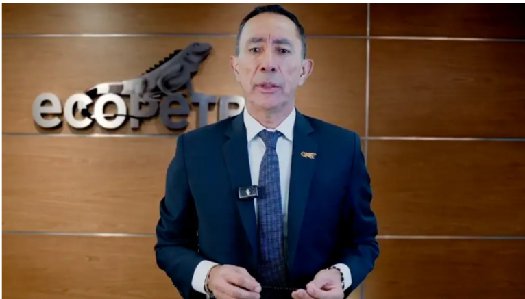
Presidente de Ecopetrol, Ricardo Roa

Según explicó, la preocupación radica en que la empresa cotiza tanto en Colombia como en Estados Unidos, lo que la expone a regulaciones de entidades como la SEC y otros organismos internacionales.