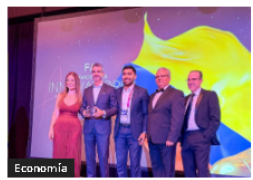
Fintech Americas 2026: Firms colombianas lideran inclusión