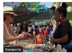
Bancóldex y Cámara Cartagena apoyan mipymes con créditos