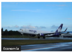
Wingo lanza rutas desde Medellín: Guatemala y Jamaica con precios