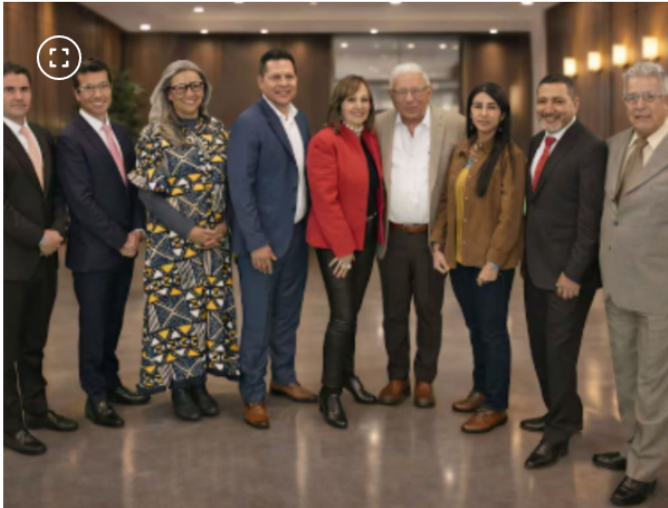
Miembros de la junta directiva de Ecopetrol .