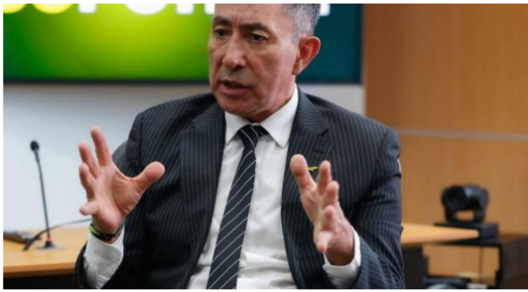
Ricardo Roa presidente de Ecopetrol .

Para la USO, la crisis de la petrolera no es un descubrimiento de la derecha, sino el resultado de gestiones cuestionables: "No es la derecha la que genera la actual crisis, son personas que pertenecieron a esta administración que denunciaron hechos que investigan las autoridades" .