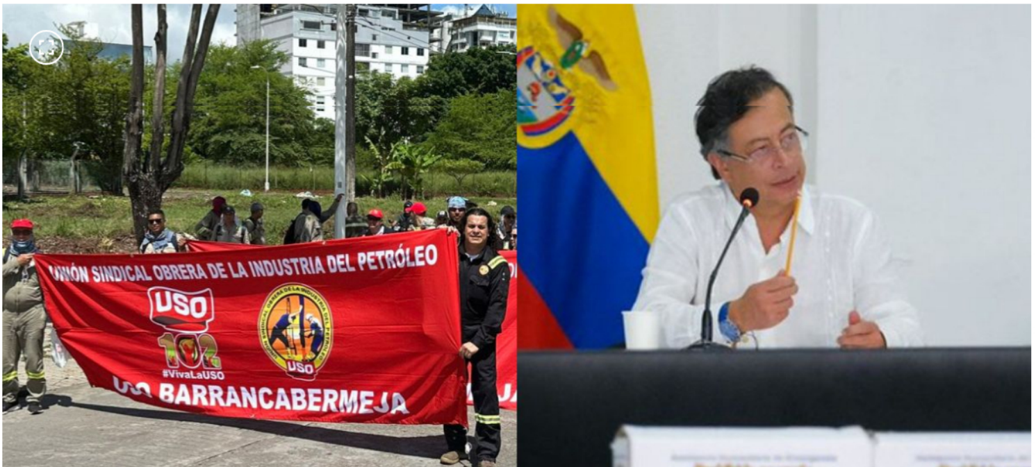
Respuesta de la USO al presidente Gustavo Petro.

La USO advirtió que la situación judicial y administrativa del directivo podría atraer sanciones internacionales.