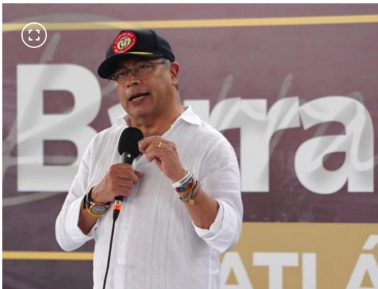
La USO envió contundente mensaje al Presidente.

El sindicato también lanzó una dura crítica a la velocidad de la transición energética propuesta por el Gobierno, argumentando que abandonar el núcleo del negocio pone en jaque la estabilidad de la empresa más importante del país. Según el