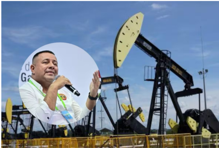
La USO anuncia movilización nacional si la junta directiva de Ecopetrol no aparta a Ricardo Roa de su cargo

Siga las noticias de Vanguardia en Google Discover