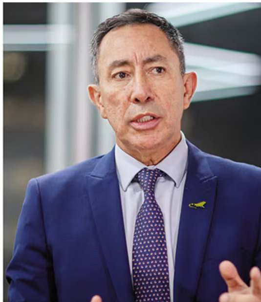
Gustavo Petro volvió a defender al presidente de Ecopetrol , Ricardo Roa.

Un particular mensaje publicó el presidente de la República, Gustavo Petro, a la petición que elevó la Unión Sindical Obrera de la Industria del Petróleo (USO) para que fuera apartado del cargo el presidente de Ecopetrol , Ricardo Roa.