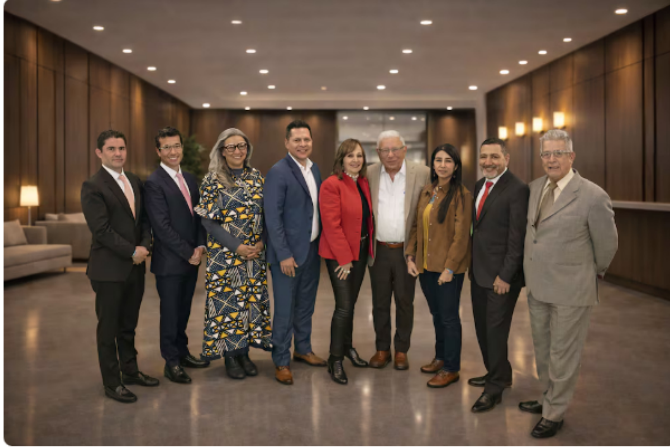
Junta de Ecopetrol 2026

Todo, por "los cuestionamientos hacia Ricardo Roa Barragán, lo cual ha afectado la reputación de la empresa", dice la carta.