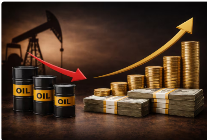
petróleo, el precio va para arriba, la producción en Colombia, no tanto.