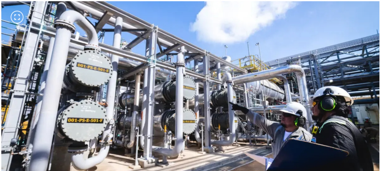
Refinería de Cartagena.

Una comisión investigadora fue designada para determinar las causas del incidente.