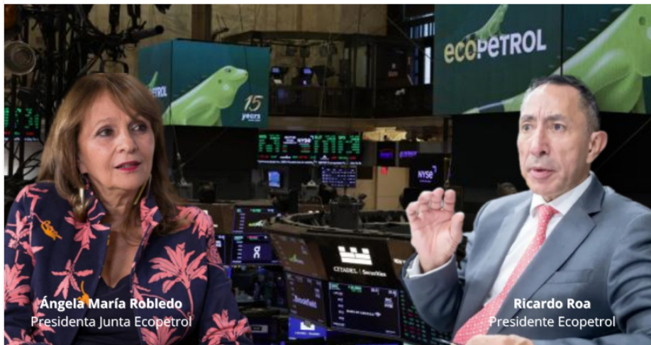
Ángela María Robledo Presidenta Junta Ecopetrol