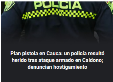
Plan pistola en Cauca: un policía resultó herido tras ataque armado en Caldoño; denuncian hostigamiento