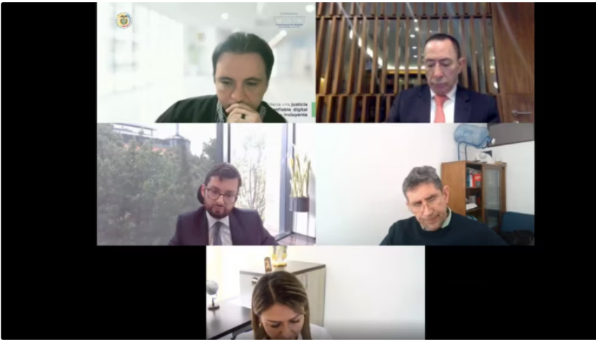
La Fiscalía imputa cargos de tráfico de influencias contra Ricardo Roa, presidente de Ecopetrol

La trayectoria de Rojas en la industria petrolera y el camino a la presidencia de Hocol evidenciaron la complejidad de las relaciones y dinámicas de poder en el sector energético colombiano.