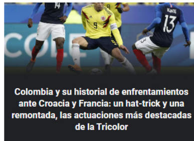
Colombia y su historial de enfrentamientos ante Croacia y Francia: un hat-trick y una remontada, las actuaciones más destacadas de la Tricolor

Ataque con explosivos a una patrulla de la Policía dejó un uniformado muerto y varios heridos en la vía Panamericana