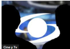
Cine y Tv

Petro arremetió tras accidente de avión militar y cuestiona compra de equipos: "Compraron una chatarra y se cayó"