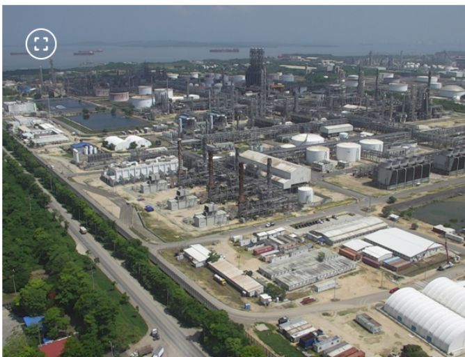
Refinería de Cartagena (Reficar)

Ecopetrol también aseguró que una comisión investigadora fue designada para determinar las causas del incidente .