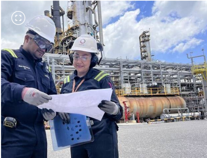
Refinería de Cartagena (Reficar)

Una vez se reportó el evento, un grupo de expertos trabajó en el restablecimiento del sistema eléctrico y en el plan de arranque secuencial de las unidades de proceso , que culminó sin incidentes.