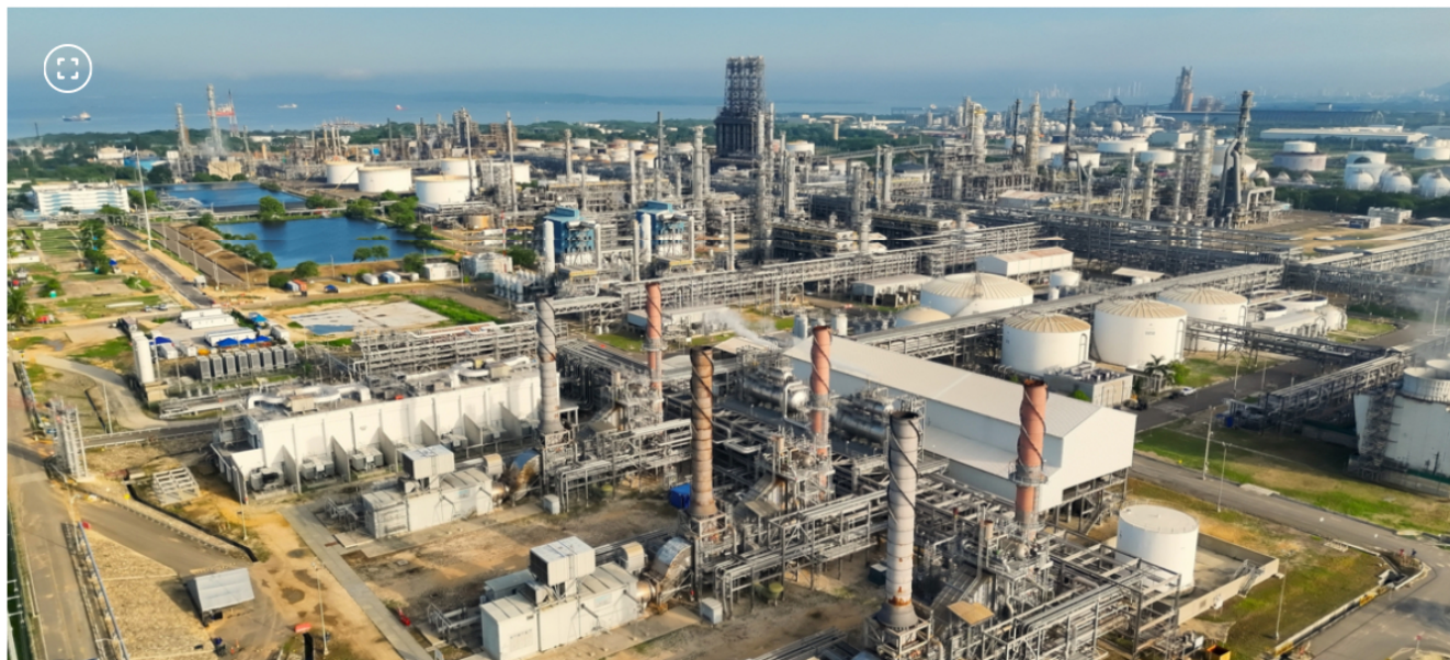
Refinería de Cartagena (Reficar)

Una comisión investigadora fue designada por Ecopetrol para determinar las causas del incidente.