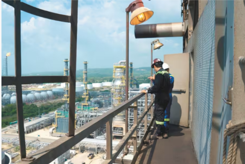
Refinería de Cartagena (Reficar). Imagen de referencia.