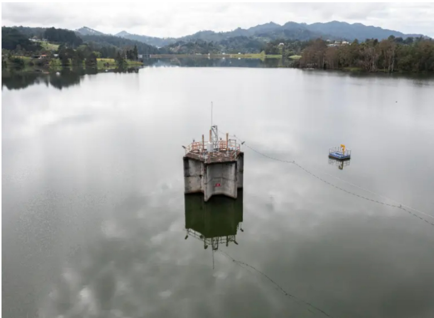
El nuevo marco tarifario de acueducto y alcantarillado afectará a 188 grandes prestadores y a más de 34 millones de usuarios en Colombia.