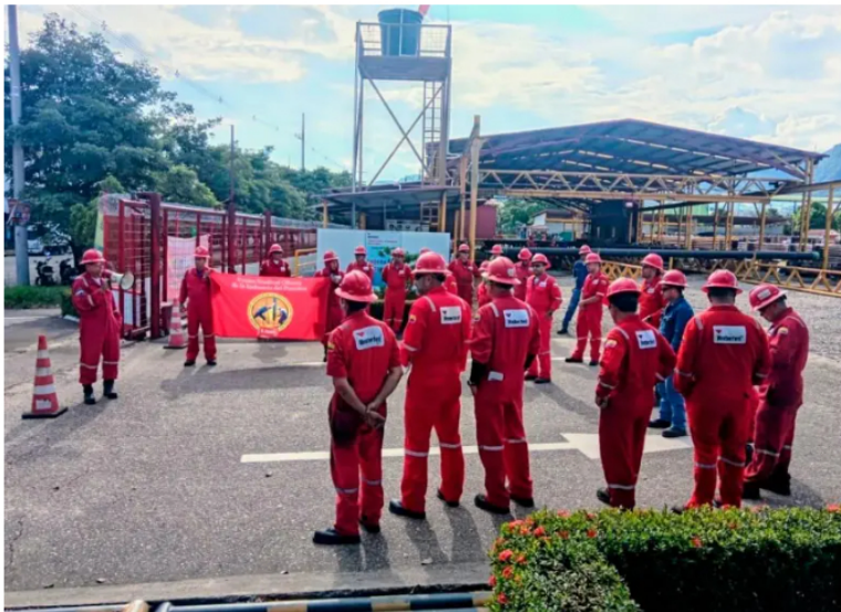
La organización advirtió que convocará movilización nacional si no se toman medidas frente a la crisis en la compañía. FOTO USO.

En ese sentido, solicitó que, en el marco de la debida diligencia, se adopten decisiones que conduzcan a apartar a Roa del cargo de presidente.