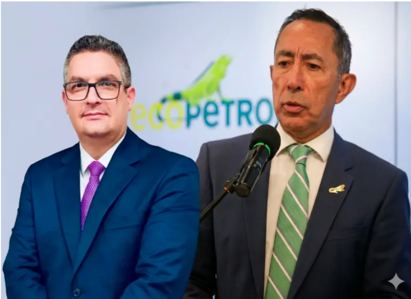
La decisión de frenar el proceso generó dudas sobre el control interno y la gobernanza en Ecopetrol.