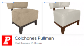
Colchones Pullman Colchones Pullman