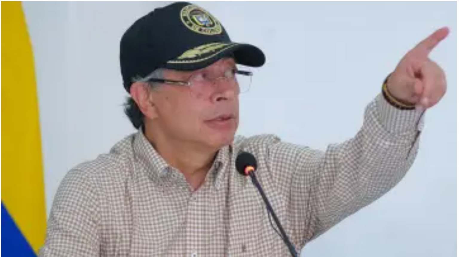
Gustavo Petro