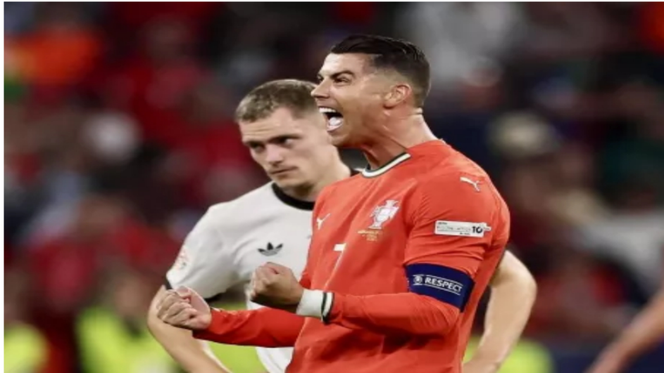
Cristiano Ronaldo sí llegaría al Mundial 2026: descartan lesión grave