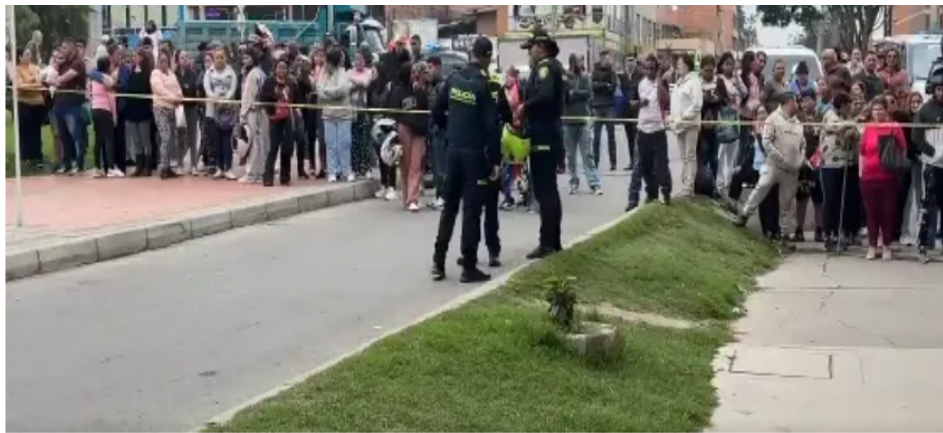
Triple feminicidio en Bosa: asesinan a una mujer y sus dos hijas dentro de su vivienda