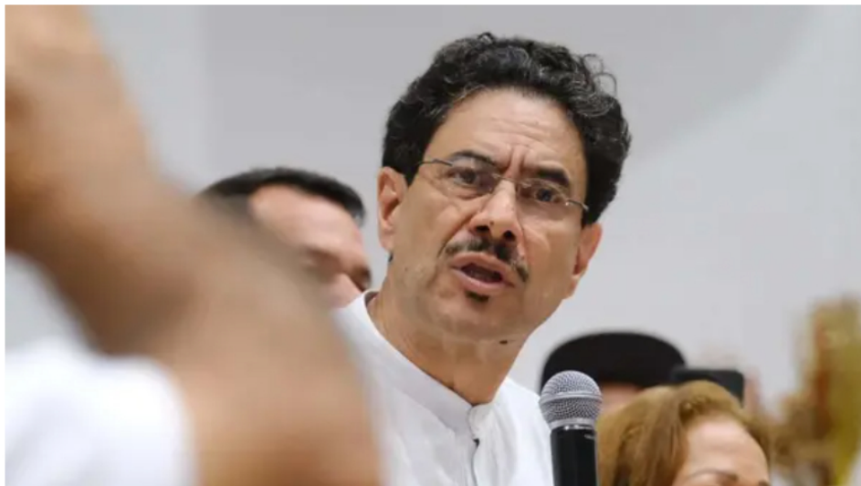
Iván Cepeda desmarca su campaña de la Constituyente y propone acuerdo nacional