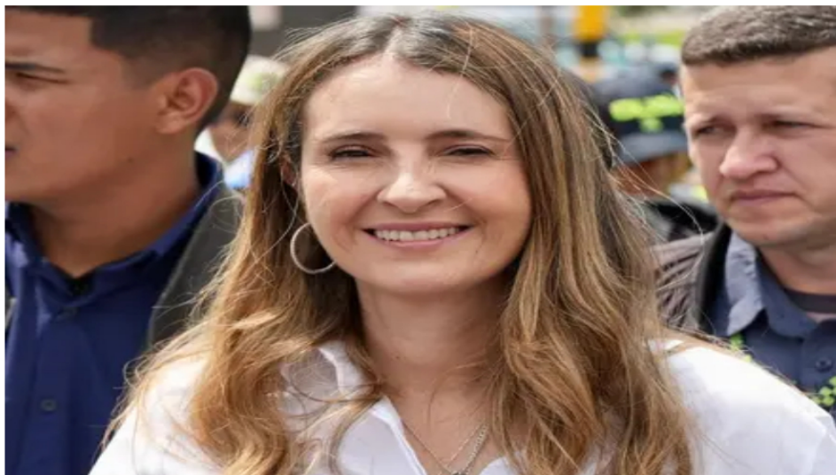
Paloma Valencia solicita a la Corte aclarar posible traslado de $25 billones de los fondos privados