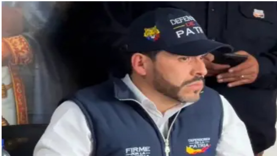
De La Espriella apunta a la segunda vuelta y denuncia campañas de desinformación