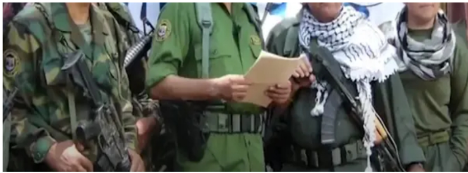
Ordenan captura de Iván Márquez y otros seis cabecillas por magnicidio de Miguel Uribe Turbay