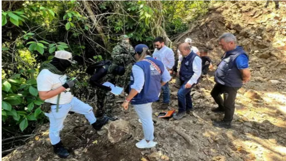
Conflicto en Santander por incursión de grupo armado ilegal Conquistadores de la Sierra Nevada