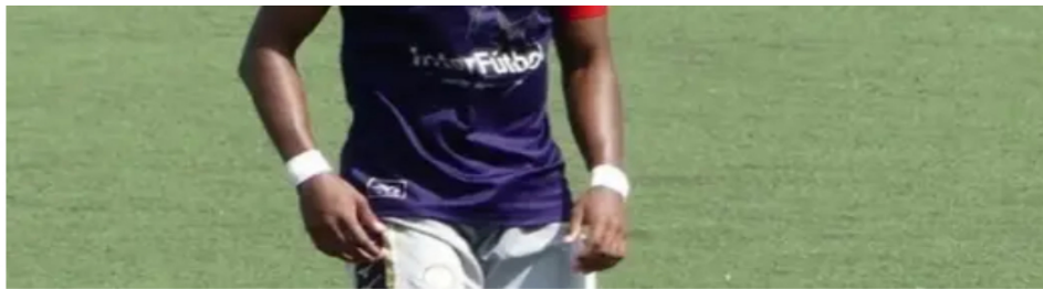
Detalles del asesinato de futbolista colombiano a las afueras de una discoteca en Medellín