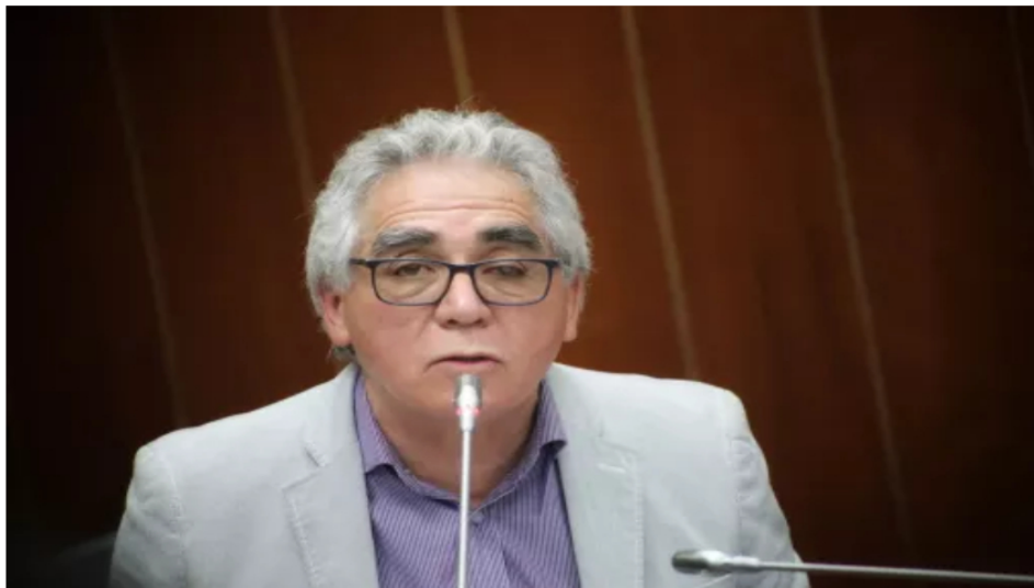
Director de la UNP será interrogado por Fiscalía en caso del magnicidio de Miguel Uribe Turbay