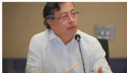
Petro respalda a Ricardo Roa en Ecopetrol y acusa a la USO de acercarse al uribismo