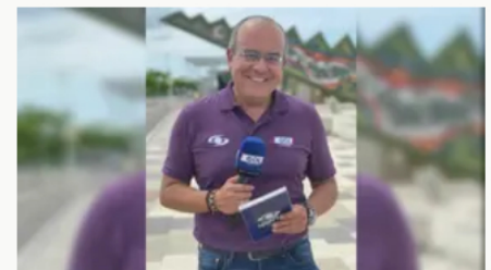
Defensa de Ricardo Orrego asegura que su salida de Caracol fue una "decisión unilateral" del canal