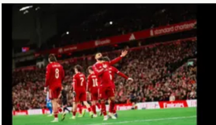
Mohamed Salah anuncia su adiós al Liverpool: el 'Rey Egipcio' deja Anfield