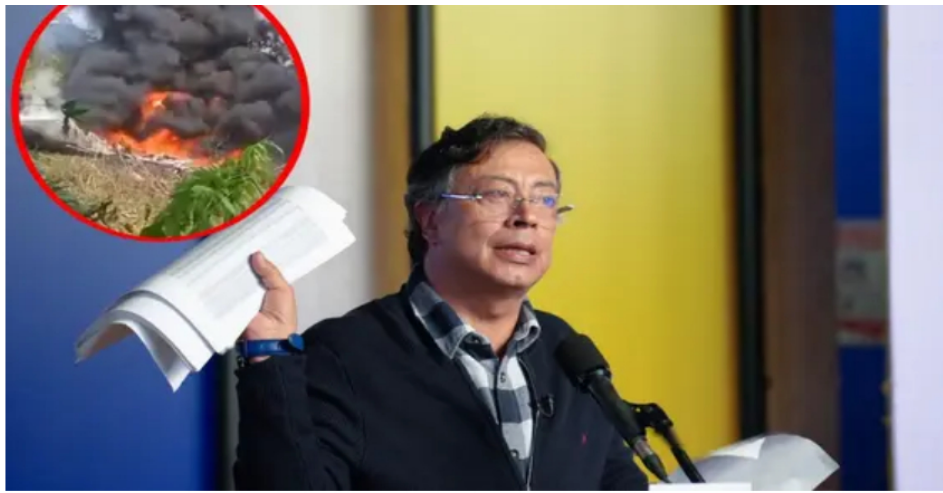
Petro decreta tres días de duelo nacional tras accidente del Hércules C-130 en Putumayo