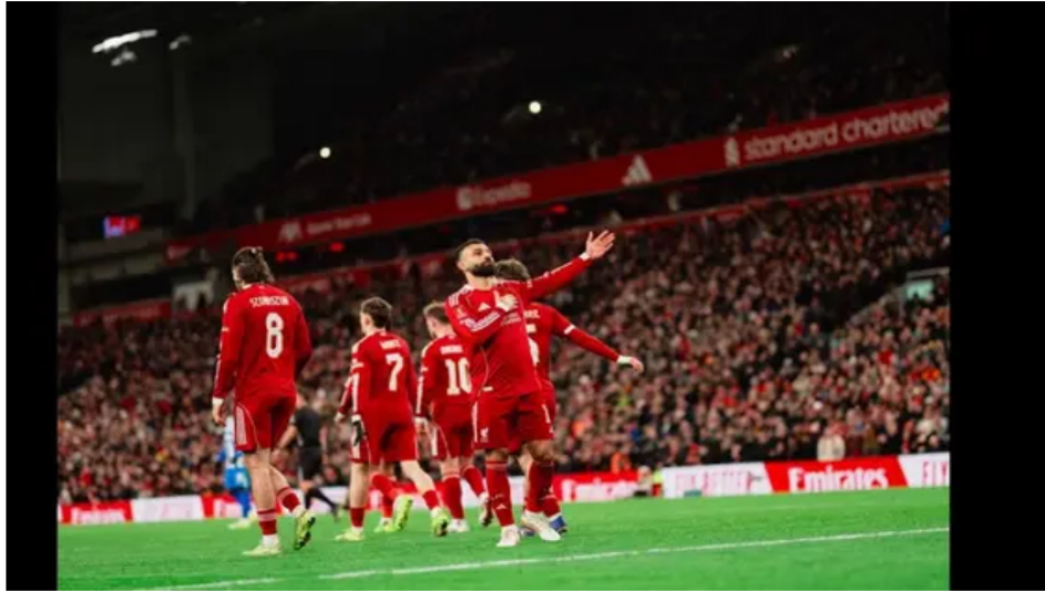
Mohamed Salah anuncia su adiós al Liverpool: el 'Rey Egipcio' deja Anfield