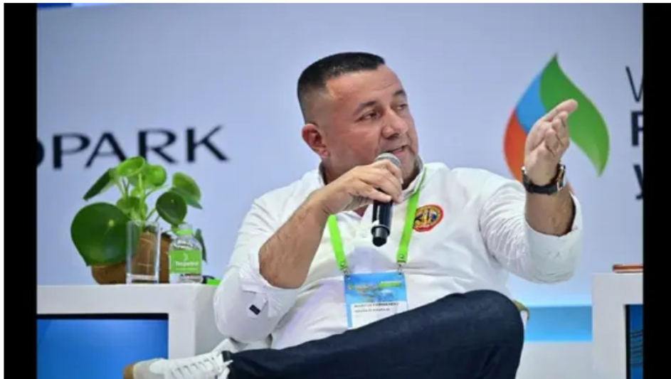
“Presidente usted nos puso en la mira de los violentos”, USO a Petro