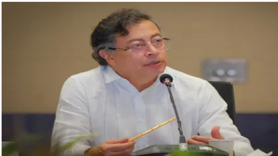
Petro respalda a Ricardo Roa en Ecopetrol y acusa a la USO de acercarse al uribismo