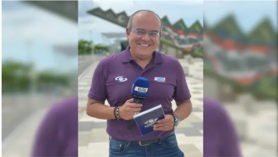
Defensa de Ricardo Orrego asegura que su salida de Caracol fue una "decisión unilateral" del canal