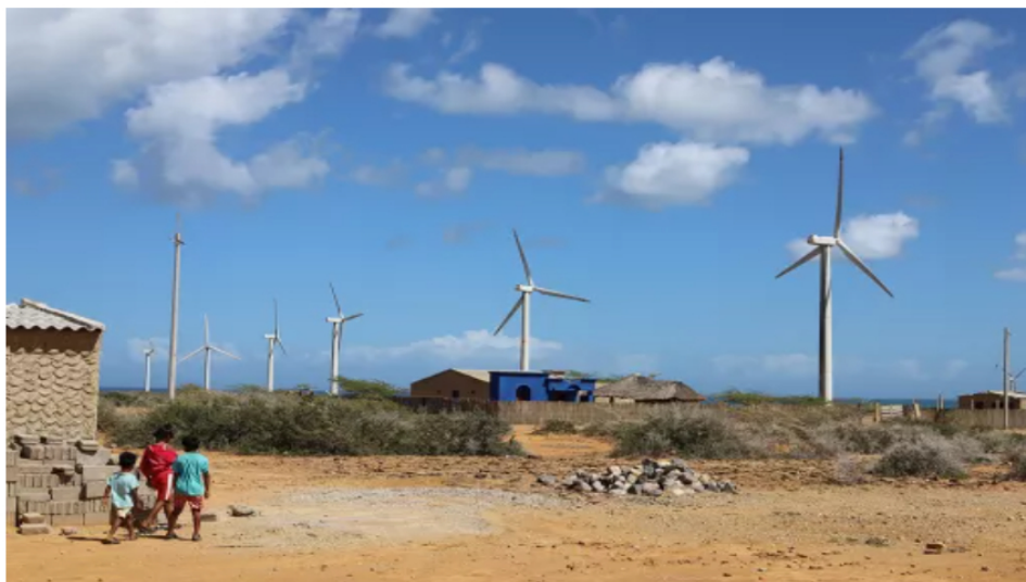
Anla otorga licencia ambiental al proyecto eólico Sirius en La Guajira y Cesar