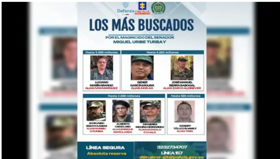
Fiscalía confirma que 'Zarco Aldinever' está vivo y ordena capturas por magnicidio de Miguel Uribe Turbay