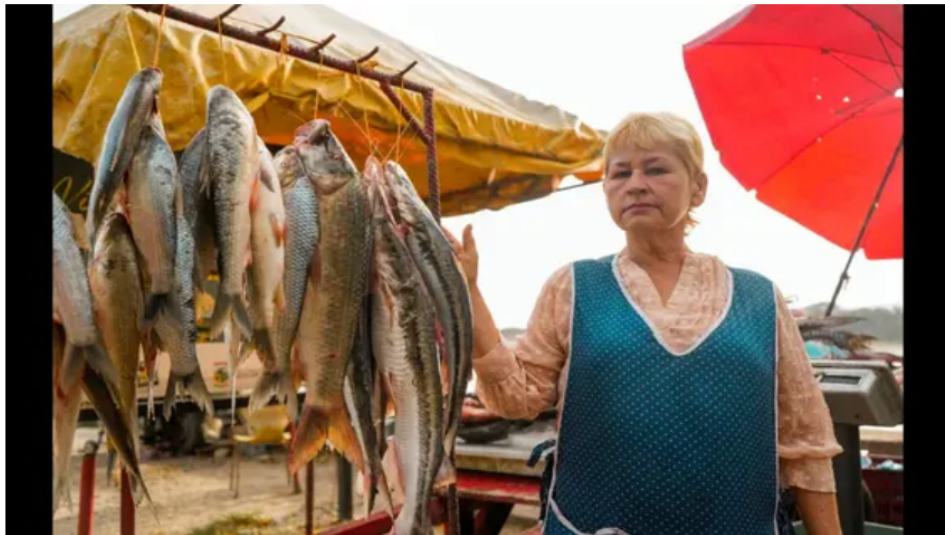
Colombia aumenta su consumo de pescado y garantiza la oferta para Semana Santa