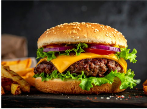
Burgerville 2026: La gran fiesta de la hamburguesa regresa a Medellín