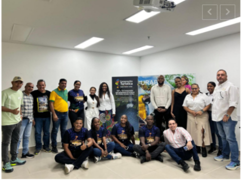
#ViveUrabá: La gran apuesta colectiva para rescatar el turismo tras la ola invernal