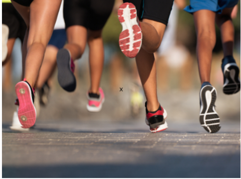
Segovia se viste de gala con el Desafío Dorado Running 2026