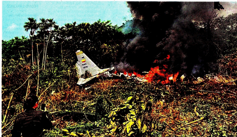
Apenas unos segundos en el aire se sostuvo el Hércules de la FAC tras su despego de Puerto Leguizamo, para luego desplomarse.