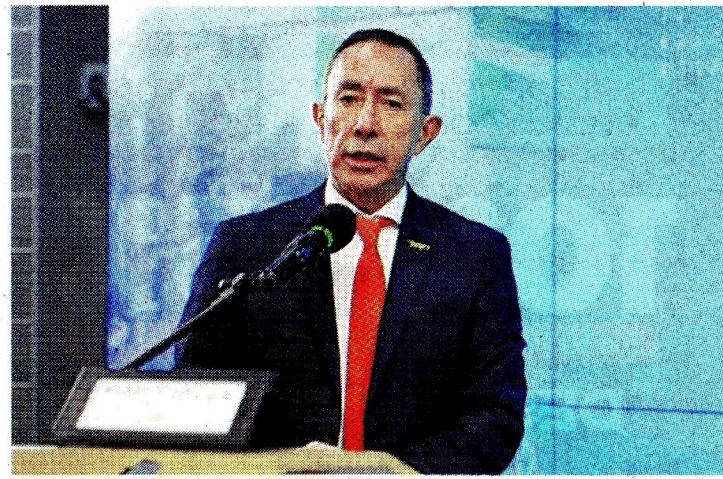
Ricardo Roa, presidente de Ecopetrol, se encuentra actualmente bajo investigación por un presunto caso de tráfico de influencias.

La incertidumbre sobre la permanencia de Roa al frente de Ecopetrol se mantiene, en la medida en que la postura del Ejecutivo es respaldarlo en el cargo.